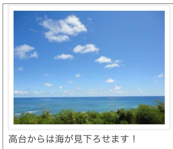
▲旅行記 写真掲載イメージ