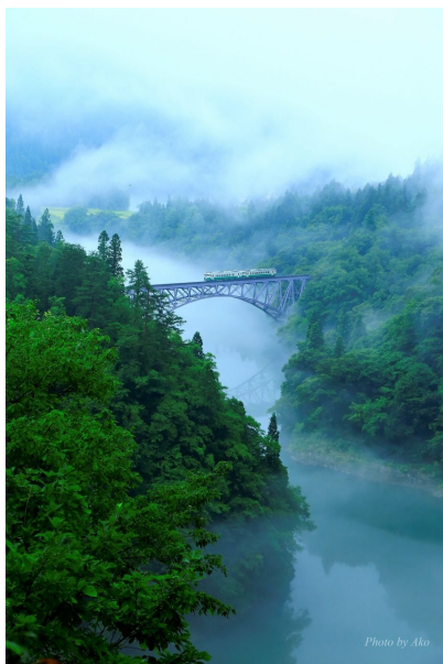
受賞者：クッシーさん 撮影場所：金山・昭和・会津美里（福島）