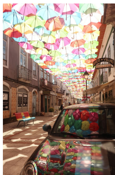
受賞者：ちろるさん 撮影場所：アヴェイロ（ポルトガル）