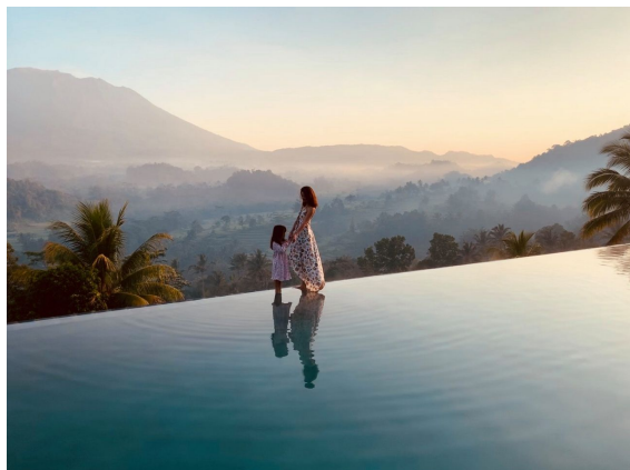
受賞者：タイブンさん 撮影場所：バリ島（インドネシア）