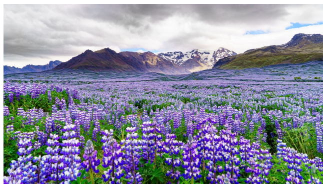
受賞者：コージさん 撮影場所：ヴィーク（アイスランド）