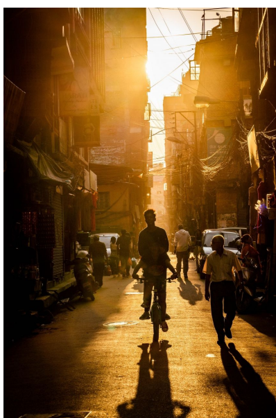
受賞者：ホワイトカレーさん 撮影場所：カトマンズ（ネパール）